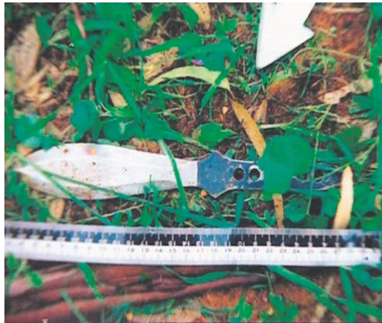
"קיבלתי לידי חומרי חקירה מיוחדים". מתוך הסרט "רצח ללא מניע"

ציים מסחריים רגולציה שמחייבת יצירה עברית, ואם לא עומדים בכך או העדר ציים חוטפים קנסות וסנקציות. תראי מה קורה עם הקולנוע הרגיל וגם התיעודי. "אנחנו אימפריה, אנחנו על המפה העולמית. כל הסרטים מוצגים ומתמור דדים בפסטיבלים בינלאומיים. הסרטים שלי מוזמנים להרבה מאוד פסטיבלים. מכירים בעולם ומעריכים את הקולנוע הישראלי וזה מאוד משמח אותי. אני מקווה שכל הקולות שקוראים לבטל את הרגולציה לא יגברו, כי הרגולציה הזאת מאפשרת לי לעשות סרט בכל שנה".